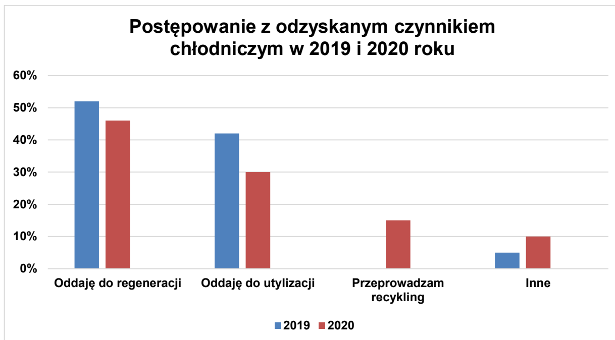
Wykres 2 – postępowanie z odzyskanym czynnikiem chłodniczym w 2019 i 2020 r..